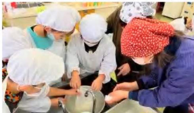
ボウルに丁寧に豆腐を移す児童ら

児童は「固まった豆乳を型に入れる時が一番楽しかった」「今まで食べた豆腐の中で一番おいしい」と笑顔を見せ、食材が口に入るまでに多くの工程があることも実感していた。