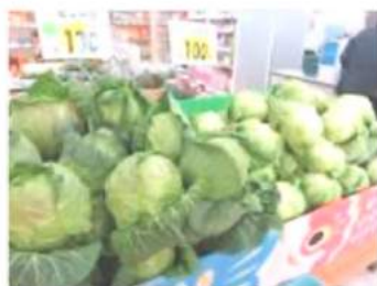
高原野菜の産地 ならではの新鮮さ!