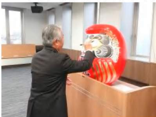
だるまに目を入れる北沢組合長

は、自ら気づき行動できる職場を全員で築いてもらい、地域の皆様に奉仕の気持ちを持って業務にあたってもらいたい」と呼びかけた。