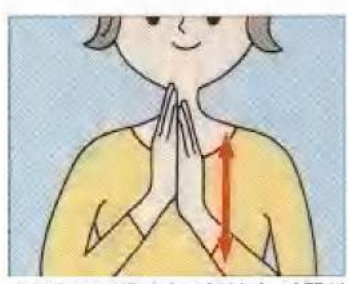
(1) 手のひら同士をこすります。時間が あるときは手の甲側もこすりましょう。