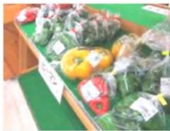
生産者の皆さまが 手間暇かけた農産物が並び!