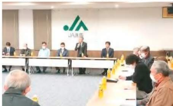
挨拶をする北沢組合長

北沢組合長は、会議の冒頭で「産地を守るために課題のある取り組みについて、本年度の反省を踏まえ次年度への方角づけをお願いしたい」と挨拶をした。