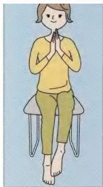
(3) (1) (2)を同時に行い、手足を共 に温めます。