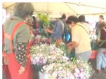
お盆お花まつり 毎年大盛況です!

〔15%の用途は… 13.5%をJA手数料として 1.5%を直売部会経費として取り扱います。〕