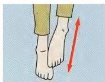
(2) 足の甲側を、反対側の足の指や 足裏でこすります。足のつぼは甲にも 多くあります。