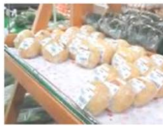
おやき・げんこつあげなど おいしい加工品も魅力!