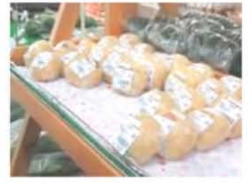
おやき・げんこつあげなど おいしい加工品も魅力!