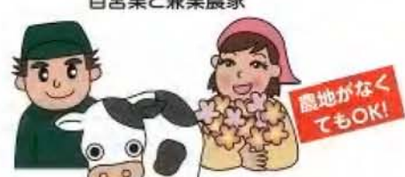
農地の権利名義を持たない 畜産農業者・施設園芸等農業者など