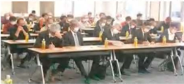
市場の代表者から説明を受ける生産者ら

北沢組合長は会議冒頭で「秋作では高温干ばつのなか、生産者の皆様に頑張っていたいただきました。現在、農協グループ全体で食料・農業・農村基本法の改正にあたって、生産価格の上昇分を販売価格に転嫁できるよう国に陳情しております。生産者にとって良い方向に向くようにしたい」と生産者を激励した。