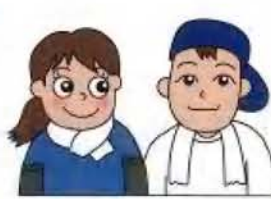
農業従事者 農家のパートさん