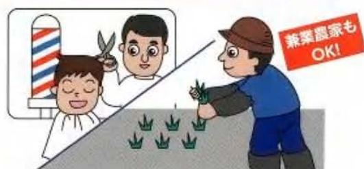
自営業と兼業農家