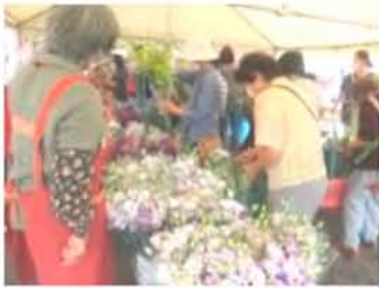
お盆お花まつり 毎年大盛況です!

〔 15%の用途は… 13.5%をJA手数料として 1.5%を直売部会経費として取り扱います。 〕