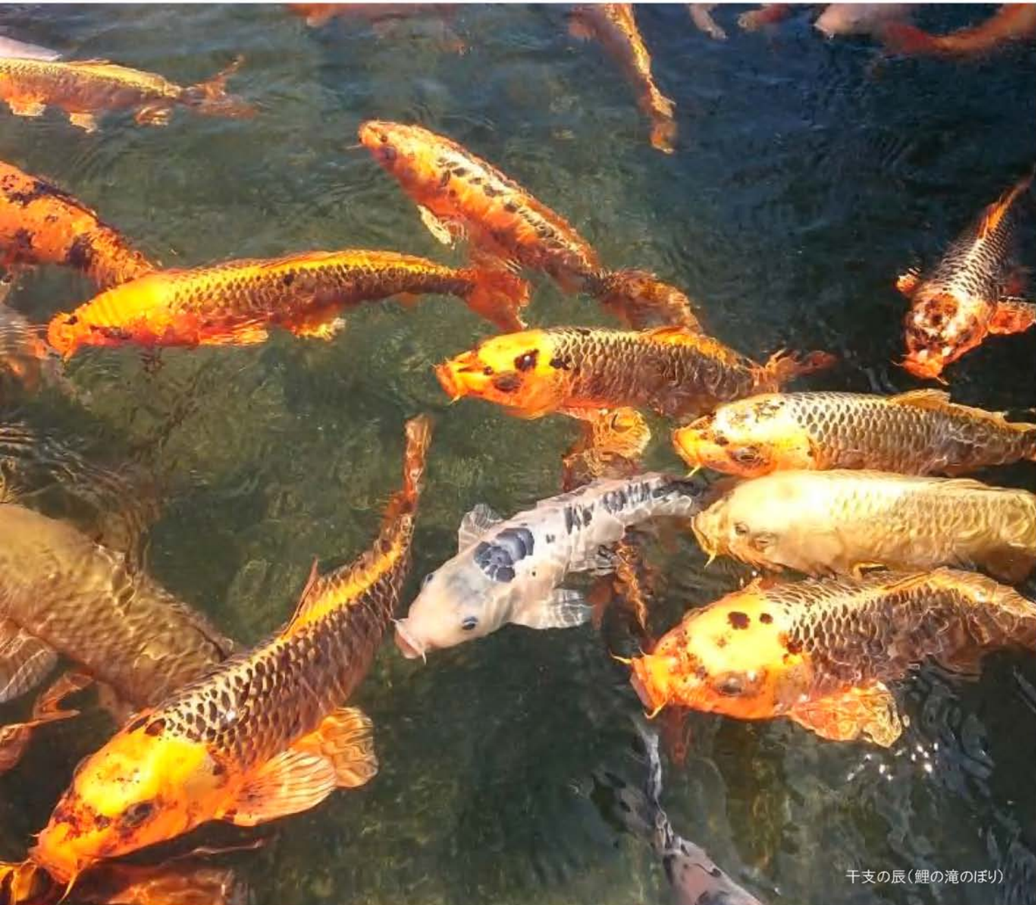
千支の辰(鯉の滝のぼり)