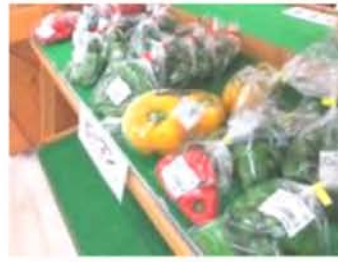
生産者の皆さまが 手間暇かけた農産物が並ぶ!