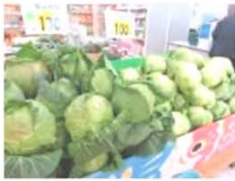
高原野菜の産地 ならではの新鮮さ!