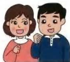
後継者とその配偶者