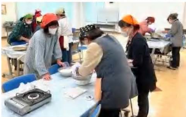
豆腐づくりを行う女性部員ら

講習会では実際に豆腐を作りながら、小学生が豆乳と「おから」を布で絞ってこす工程で、やけどがないような工夫を考えた。室温により調理時間が変化することなどを確認し、小学校での実習に備えた。にぎやかな講習会の最後は、できたての手作り豆腐と濃厚なおからのサラダを楽しんだ。