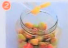
2 保存容器に入れ、分量のらっきょう酢を注ぐ。蓋し蓋をし、涼しい所へ保存する。