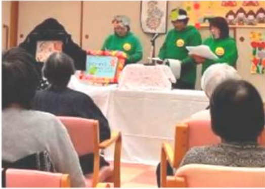
利用者へ読み聞かせを行うにここの会のメンバー

パネルシアターや大型絵本を使った子供向けの活動やハンドベルにも挑戦したい」と語った。クレアセバでの2ヶ月に1回の発表も計画されている。