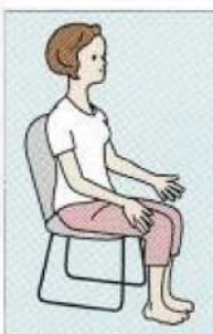
(4) 両手を開いて肘を伸ばしたときに足を下ろし、再び肘を曲げて両手を握るときに今度は左足を上げます。(3)から(4)の動作を10回繰り返します。