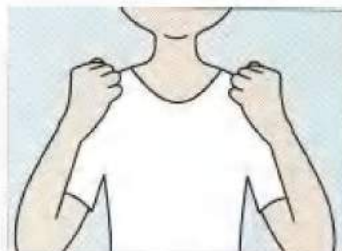
(1) 肘を曲げ伸ばしながらグーパーの体操を行います。両手を握ったときに肘を曲げます。