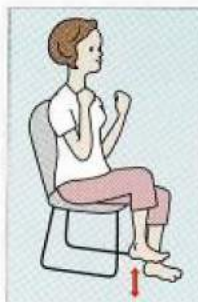
(3) (1)と(2)の動作に慣れたら、いすに座った状態で足の動きを加えます。肘を曲げて両手を握ると同時に、股筋に力を込めて右足を引き上げます。