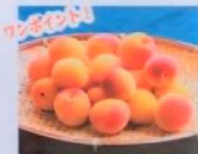
完熟梅で漬けるととっても美味しく漬かりますよ!