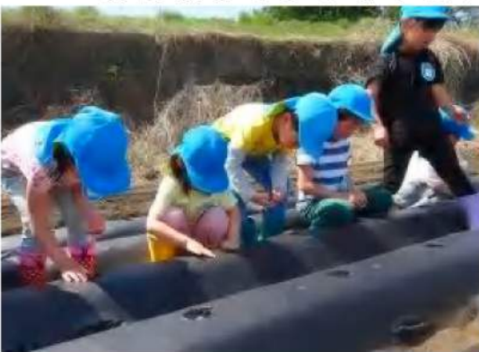
スイートコーンを播種する園児ら

今年、洗馬小学校3年生と妙義保育園年長が、スイートコーンの播種と収穫を体験することに。収穫までスイートコーンの成長を見守り、観察も行う。収穫は、順調に生育すれば7月下旬の予定だ。