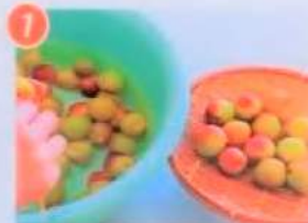
1 梅は洗い、2〜3時間あく抜きし、竹串でへたをとる。水気をしっかりとふく。