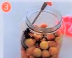
3 梅が洗剤までは1日1回は全体をかき混ぜる。2カ月で完成。