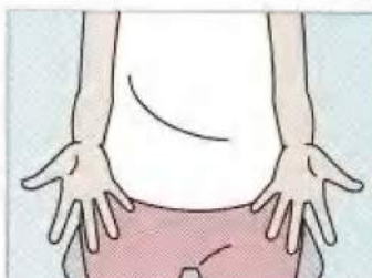
(2) 両手を開いたときには肘を伸ばし、全ての指先を伸ばします。まずは、(1)から(2)を10回程度行って動きに慣れましょう。