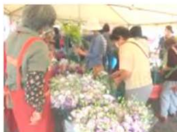
お盆お花まつり 毎年大盛況です!

〔15%の用途は… 13.5%をJA手数料として 1.5%を直売部会経費として取り扱います。〕