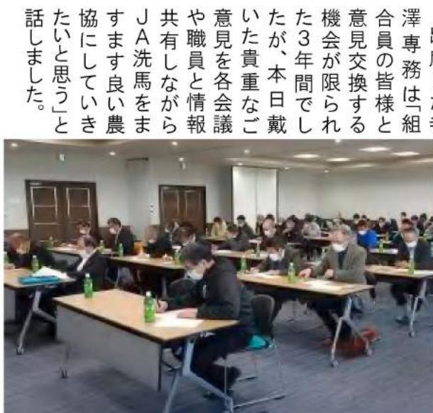
J Aからの説明に耳を傾ける組合員

出席した寺澤専務は「組合員の皆様と意見交換する機会が限られた3年間でしたが、本日戴いた貴重なご意見を各会議や職員と情報共有しながらJ A洗馬をますます良い農協にしていきたい」と話しました。