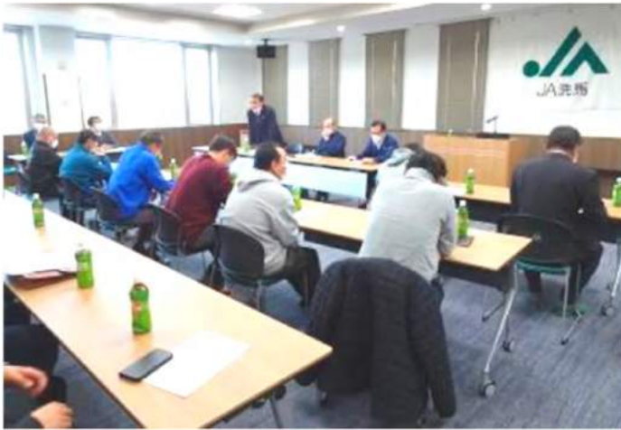
分散会で意見を協議する組合員

A 集客については直売所運営の最重要課題ととらえております。店舗情報やイベント案内など情報発信についてもLINEを中心に各種メディア等、機会があれば積極的に発信していきます。