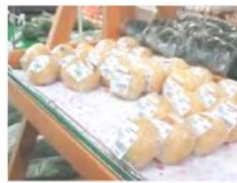
おやき・げんこつあげなど おいしい加工品も魅力!