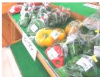
生産者の皆さまが 手間暇かけた農産物が並び!