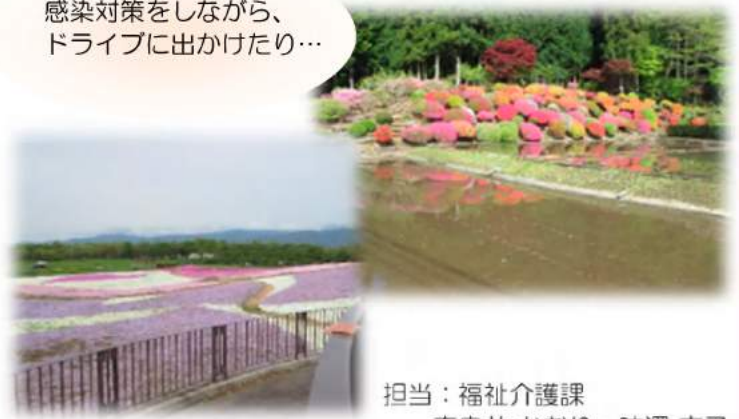
担当：福祉介護課 奈良井 かおり・味澤 京子