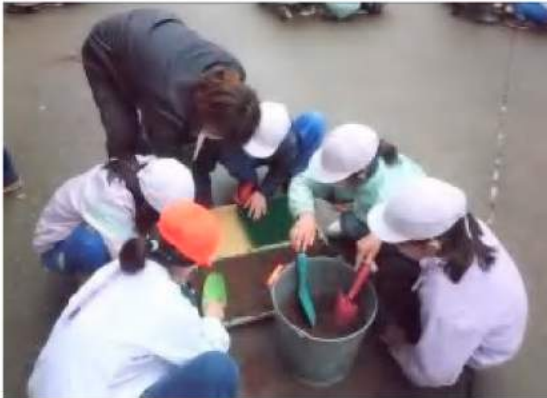
児童と女性部役員による種まき

4年生の児童は「5年生から教えてもらいながら楽しく出来た。」と楽しそうに話していました。種まきしたレタスは、順調に育つと5月中旬に苗を定植し、7月上旬には全学年で収穫する予定です。