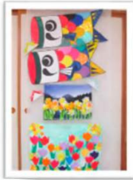
ちぎり絵や折り紙で作品作成