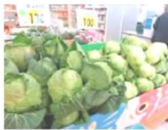
高原野菜の産地 ならではの新鮮さ！