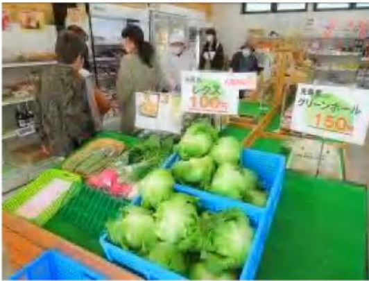
新鮮な野菜と加工品を求めて賑わう直売所アピス

1年の小規模な直売所だが、洗馬という野菜や果物の栽培が盛んな地域なので、他の直売所には無い魅力的な店舗を目指したい」と抱負を語りました。営業時間は、9時〜17時(日曜定休)