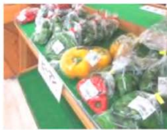
生産者の皆さまが 手間暇かけた農産物が並ぶ！