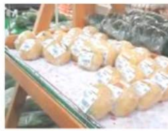
おやき・げんこつあげなど おいしい加工品も魅力！