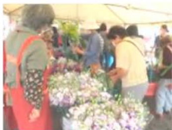
昨年8月のお盆お花まつり 毎年大盛況です！

〔15%の用途は… 14.5%をJA手数料として 0.5%を直売部会経費として取り扱います。〕