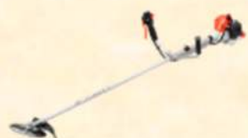
SRE2430UT ¥46,000 (税込) 本体質量:4.3kg

暑い日が続く様になりました。そろそろ新しい草刈り機を・・・とお考えの方もいらっしゃるのではないのでしょうか。刈払機・畦草刈機など各種メーカーでご案内が可能です。是非この機会にご利用ください。