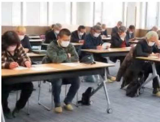
JAからの説明に耳を傾ける参加者

A 発電パネルや制御盤など、ソーラー発電に係る導入費用は上昇している反面、売電単価は一時期よりも下降している状況も見受けられます。現在は、投資金額を回収するのに約20年かかるとの試算も出ており、今後における国のエネルギー政策などを注視しながら検討して参ります。