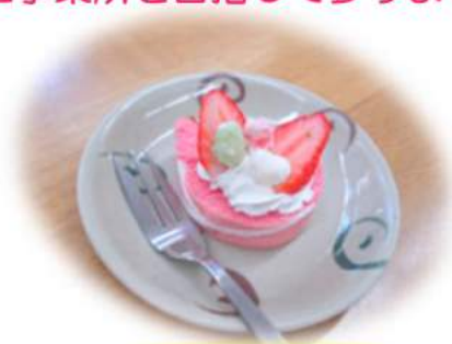
3月3日のひな祭り 午後のおやつ (いちごケーキ)