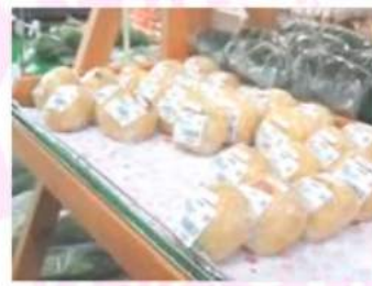
おやき・げんこつあげなど おいしい加工品も魅力!