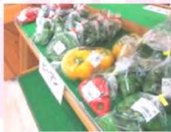
生産者の皆さまが 手間暇かけた農産物が並び!