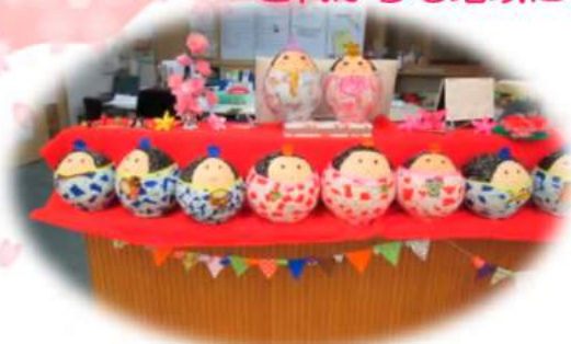
職員と利用者様が一緒に作ったひな人形です!

ご利用者様が住み慣れた地域で安心して生活する事が出来るよう、 これからも地域に根付いた事業所を目指して参ります。