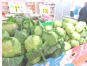
高原野菜の産地 ならではの新鮮さ!