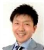
気象予報士・防災士 檜山靖洋 ひやまやすひろ

1973年横浜市生まれ。 明治大学政治経済学部政治学科を卒業後、印刷会社に就職。 1999年に気象予報士を取得し気象会社へ転職。 2005年からNHKの気象キャスターに。 朝のニュース番組「おはよう日本」の気象情報に出演中。