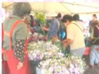
昨年8月のお盆お花まつり 毎年大盛況です!

〔15%の用途は… 14.5%をJA手数料として 0.5%を直売部会経費として取り扱います。〕