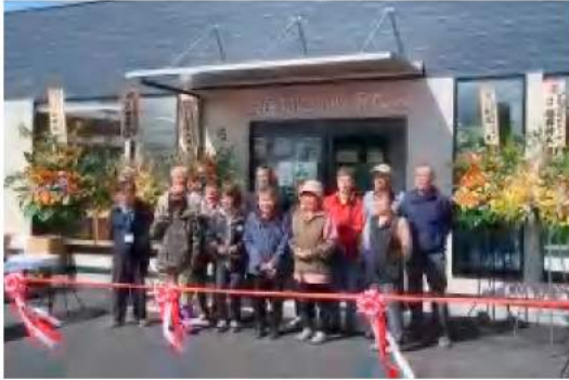
直売所オープン(部会員さんと)

昨年5月に農産物直売所アピスがオープンし、8カ月が過ぎました。まずは、地域の皆様からのご利用に深く感謝申し上げますとともに、現在までの状況を振り返り、生産者直売部会の立場から、これからの展望について考えてみたいと思います。