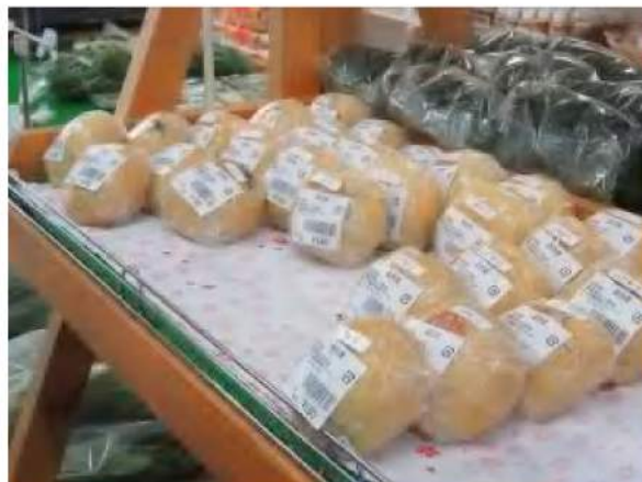
農産物加工部会の出来立て加工品

洗馬産の新鮮野菜をはじめ、山菜や果物、農産物加工品、そして一般食料品から日用雑貨等で店内が構成されています。