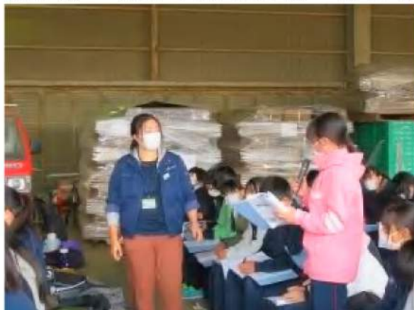
塩尻西部中1年生!! 熱心な姿に感心しました

J A洗馬では、地元小学校とのレタス栽培を通じた交流を長年行っていますが、塩尻西部中学校の校外学習を通じた交流は今回がはじめて。今後も次世代との「つながり強化」に向け、学校等との連携を深めていきたいですね。