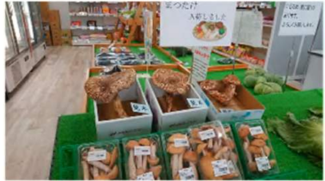
秋には松茸も並びました！

また、現在の客層の皆様が満足いただきながら、若い年代層や洗馬地区外のお客様にも「食」の情報発信を通じて、洗馬地区の農業や農村の魅力を伝えていくことが大切だと思います。