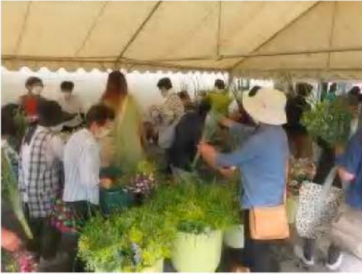
大盛況だったお盆のお花まつり