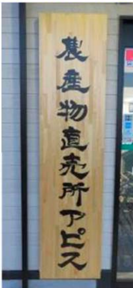
立派な看板も設置！

将来、お客様や生産者、そしてJA洗馬にとって、あつてよかった」と言ってもらえるような農産物直売所を目指して、関係者一同頑張りたいと思えます。これから皆様の協力、そして一層のご利用ご参画をお願い申し上げます。