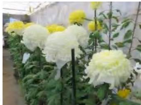
ダイナミックな大輪の中に繊細さと優雅さが漂う

どんな存在ですか」と尋ねたところ、「菊花を育てることは生命を育てること。生徒と正面から向き合うことと同じ。私自身も毎年が勉強、毎年が挑戦の日々ですが、栽培技術も日々進歩してき