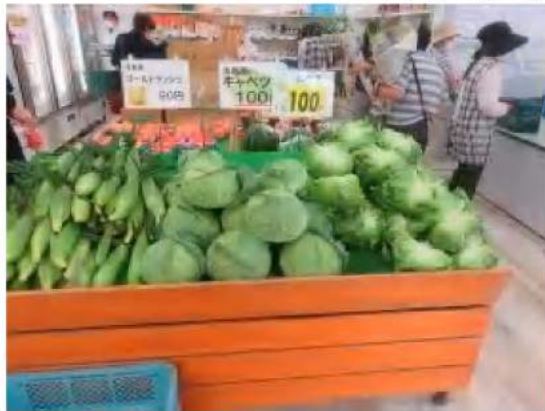
野菜産地「洗馬」ならではの新鮮な品揃い