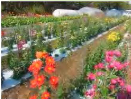
育種圃場では、色とりどりの菊が咲き揃う

また、「大菊栽培は、環境や培養土の条件など非常に繊細なバランスが必要。その上、良い花を咲かせるには、日々の観察と記録が大切です。スプレー菊の育種にも取り組みながら、最終的に仕上げるまでに4〜5年はかかります。千本の育種株から本当に自分が良