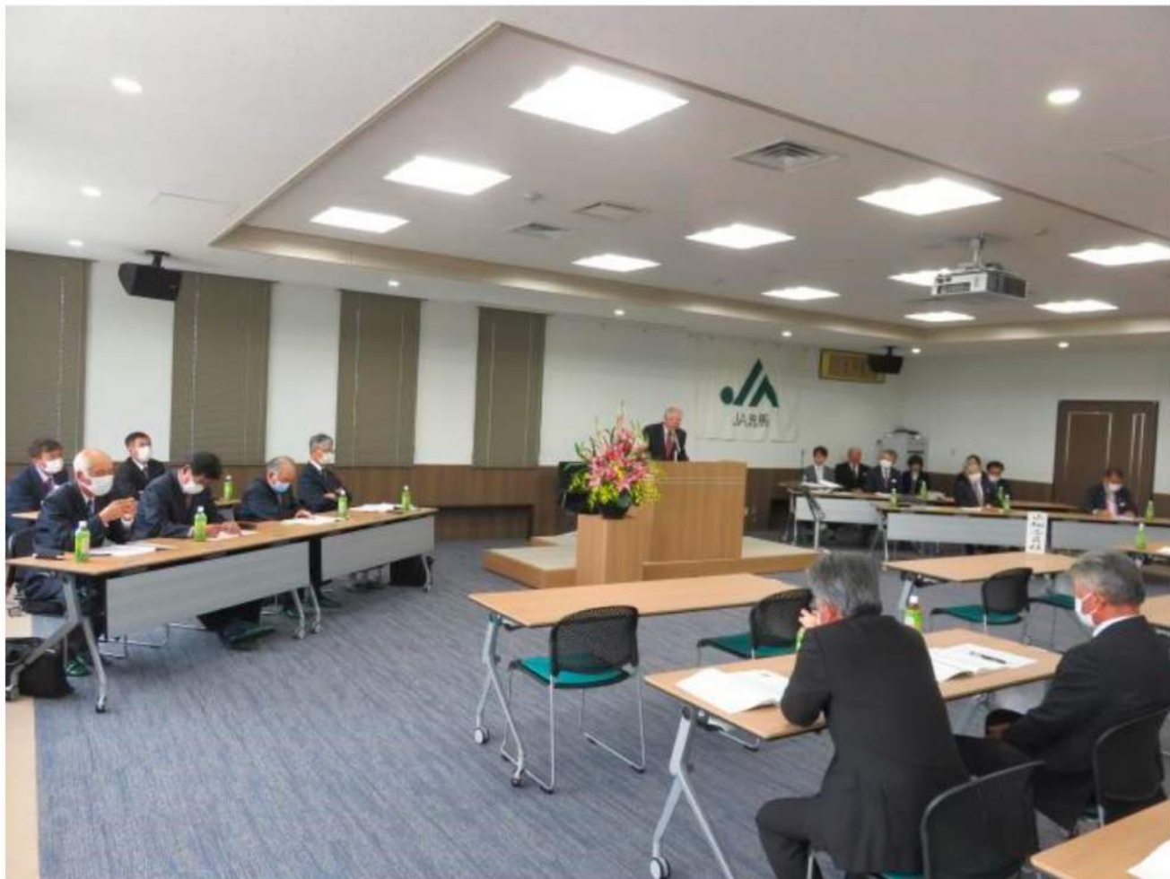
新型コロナウイルス感染症予防対策の中で開催された第72回通常総会

令和2年5月25日月曜日、JA洗馬の第72回目となる通常総会が本所にて開催されました。本年は新型コロナウイルス感染症拡大防止の観点から、ご来賓各位のご臨席については自粛をお願い申し上げます。組合員各位にも議決権行使書による議決権行使を最大限にご活用いただくようご案内を申し上げます。